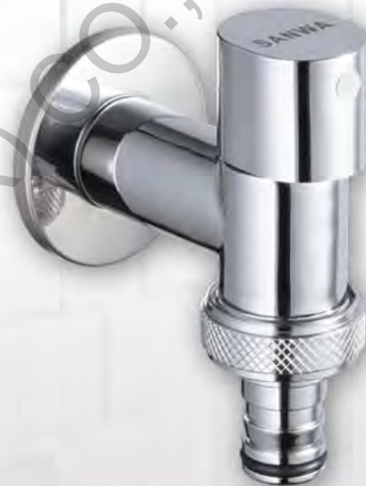
ก๊อกน้ำติดผนังเซรามิคแบบสวมสายยาง