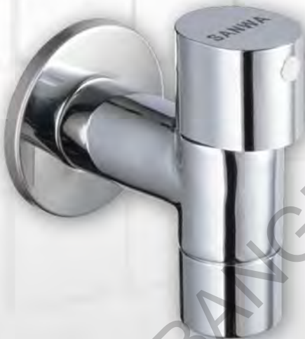
ก๊อกน้ำติดผนังเซรามิค